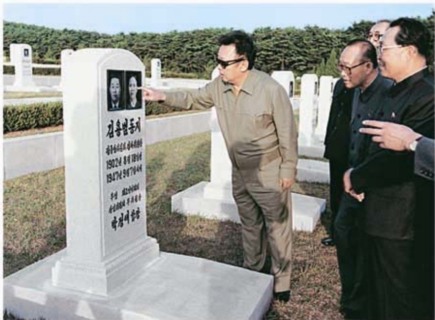
Kim Jong Il bei der Besichtigung des Ehrenhains der Patrioten (September 1998)