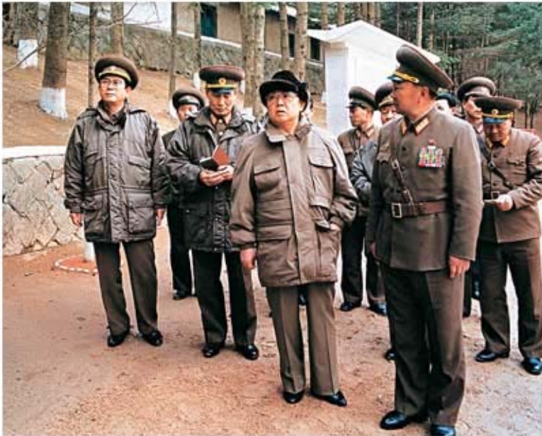
Kim Jong Il bei der Inspektion des Postens auf dem Berg Taedok (März 1996)