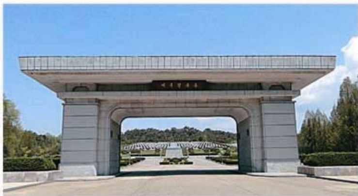
Das Tor des Ehrenhains der Patrioten