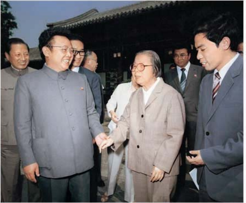
Kim Jong Il begrüßt Deng Yingchao, Präsidentin des Nationalkomitees der Politischen Konsultativkonferenz des chinesischen Volkes. (Juni 1983)