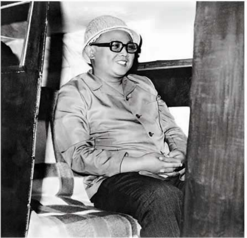
Kim Jong Il fährt im Erzbergwerk Komdok mit einem Grubenzug in einen Stollen. (Juli 1975)