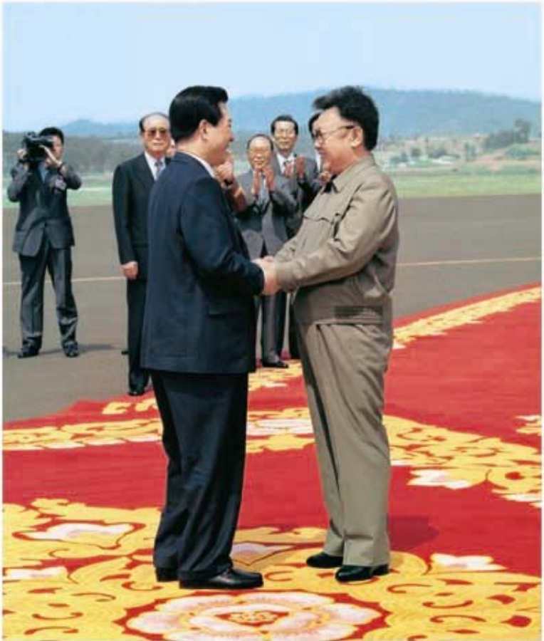
Kim Jong Il beim Treffen mit dem südkoreanischen Präsidenten Kim Dae Jung, der zum Nord-Süd-Gipfel nach Pyongyang kam. (Juni 2000)