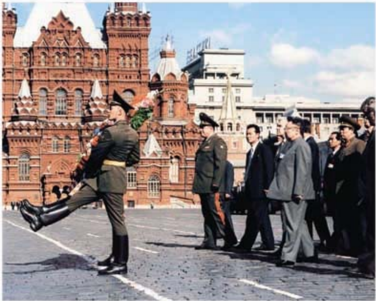
Kim Jong Il legt einen Kranz vor dem Lenin-Mausoleum nieder. (August 2001)