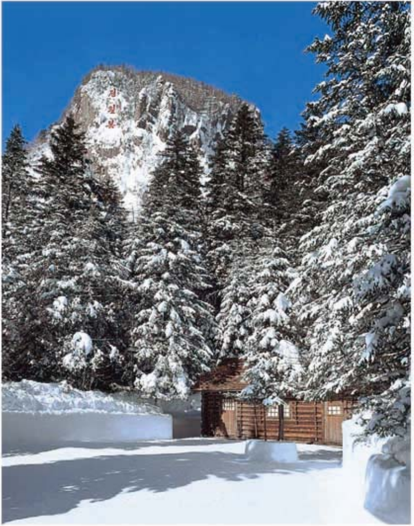
Kim Jong IIs Geburtshaus im Geheimlager Paektusan