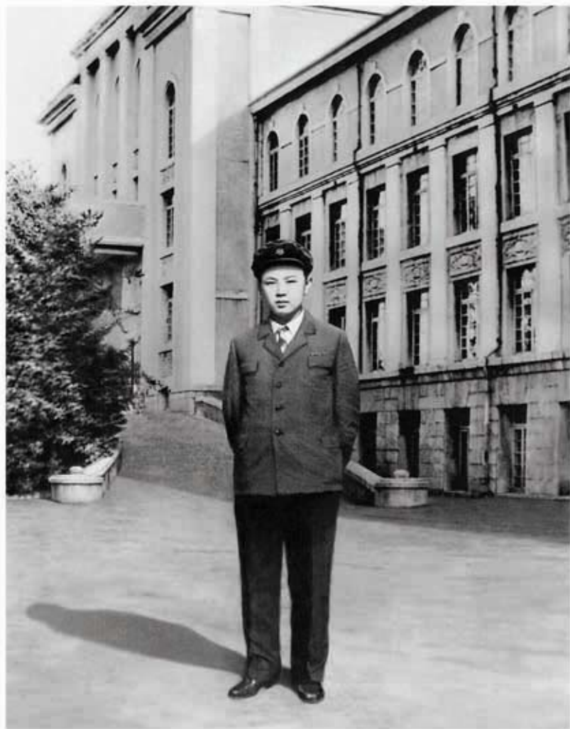
Kim Jong Il während der Studienzeit an der Kim-Il-Sung-Universität