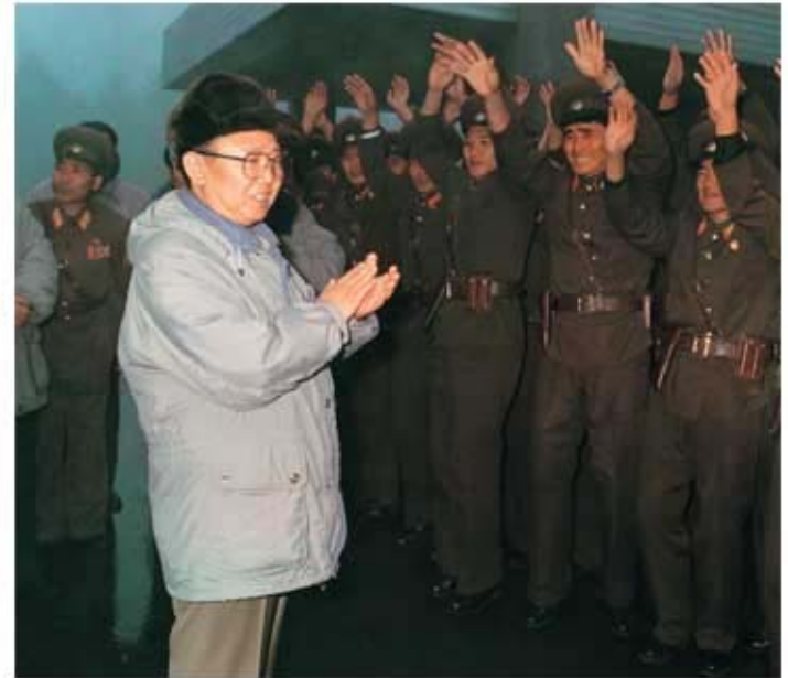
Kim Jong Il bei der Inspektion der Panmunjom-Vertretung der KVA (November 1996)