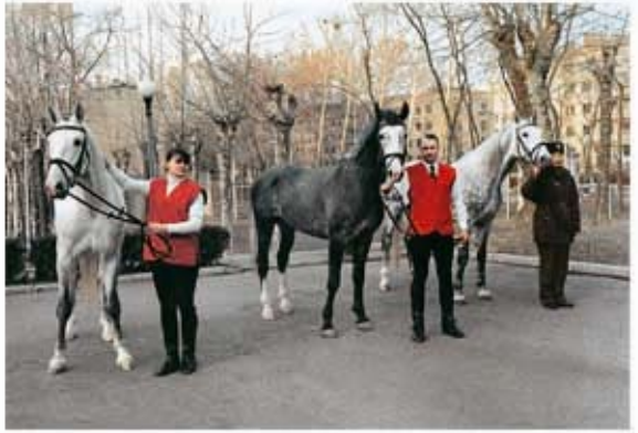
Kim Jong Il betrachtet Pferde der Orlov-Rasse, Geschenke von Wladimir Wladimirowitsch Putin, Präsident der Russischen Föderation. (Februar 2003)