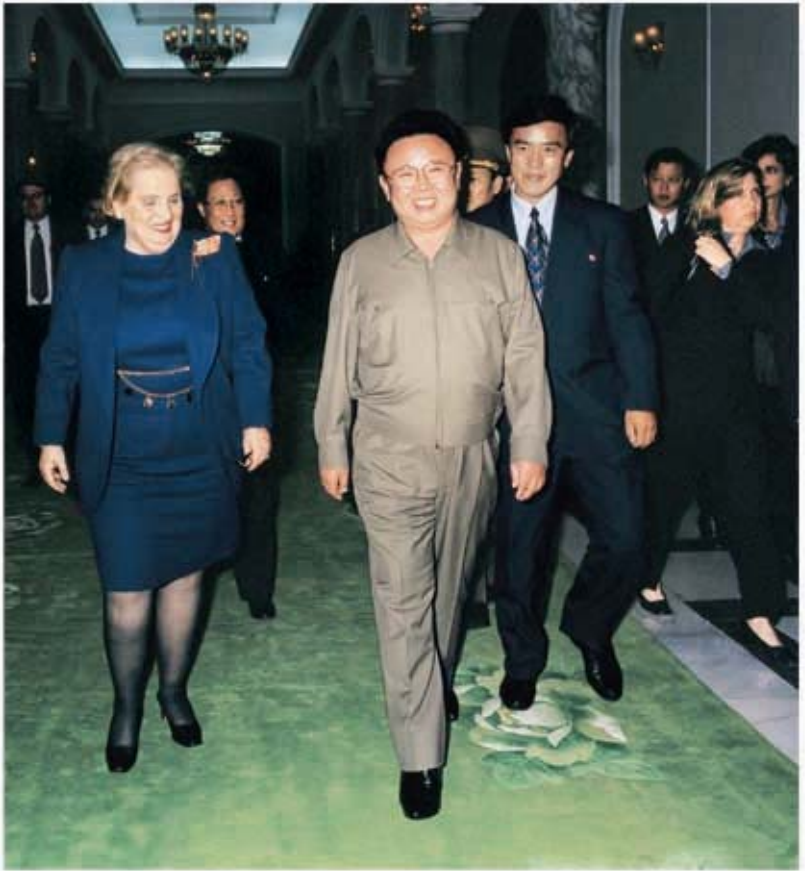
Kim Jong Il beim Treffen mit der US-Außenministerin Madeleine K. Albright (Oktober 2000)