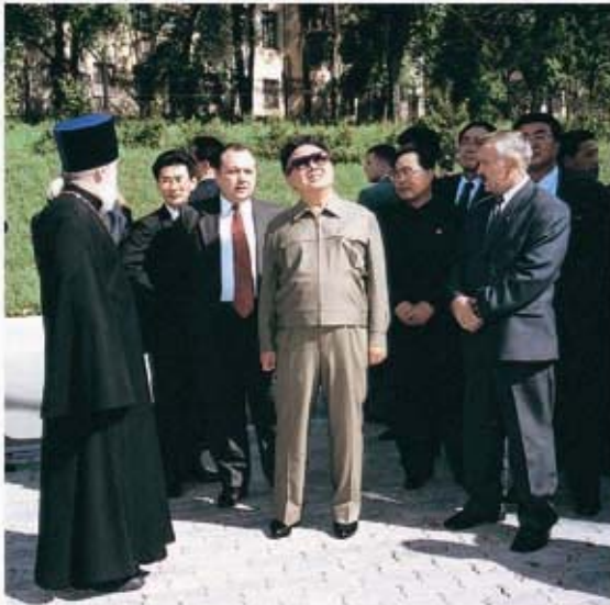
Kim Jong Il bei der Besichtigung der orthodoxen Kirche in der Stadt Chabarowsk